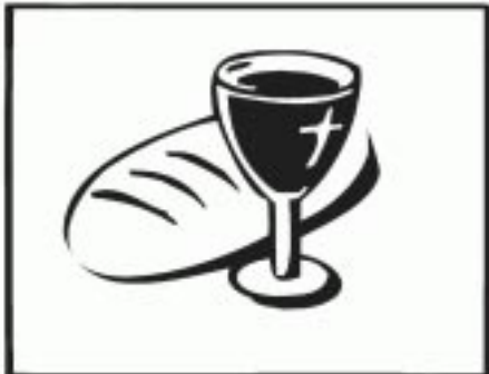
Der Tag, an dem du dich verschenkst