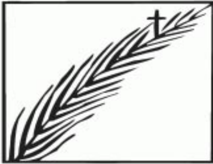
Der Tag, an dem du dem Jubel nicht traust