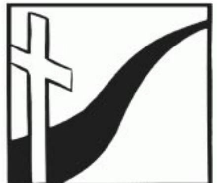
Der Tag, ab dem du mit uns gehst