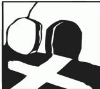
Der Tag, an dem du ins Leben kommst

Eigentümer, Herausgeber, Vervielfältigung: Pfarre Maria Treu, 1080 Wien, Piaristengasse 43, Tel. 405 04 25. Zusammenstellung: Joh. „Conny“ Schmitt.