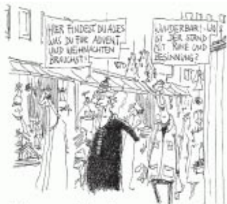
Adventsillusionen T. Pläßmann