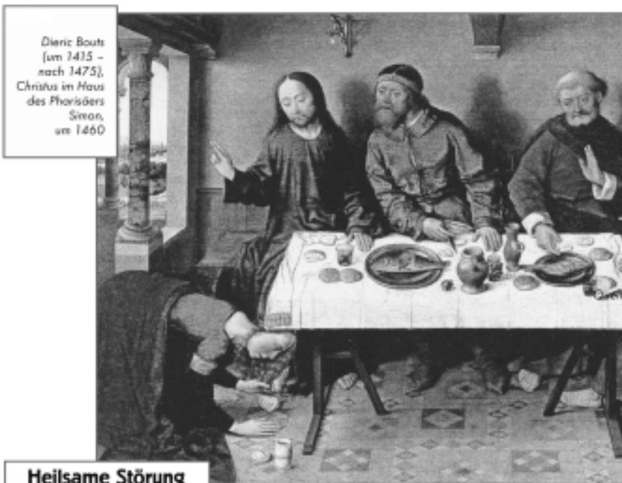
Dieric Bouts (um 1415 - nach 1475), Christus im Haus des Pharisäers Simon, um 1460

Eigentümer, Herausgeber, Vervielfältigung: Pfarre Maria Treu, 1080 Wien, Piaristengasse 43, Tel. 405 04 25. Zusammenstellung: Joh. „Conny“ Schmitt.