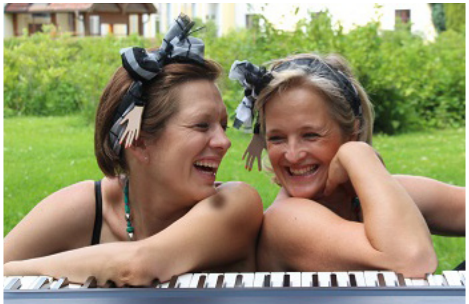
Rettet die Buckoworgel der Piaristenbasilika Maria Treu

Hl. Messen um 9.30 (Gemeindemesse) und 19.00 Uhr.